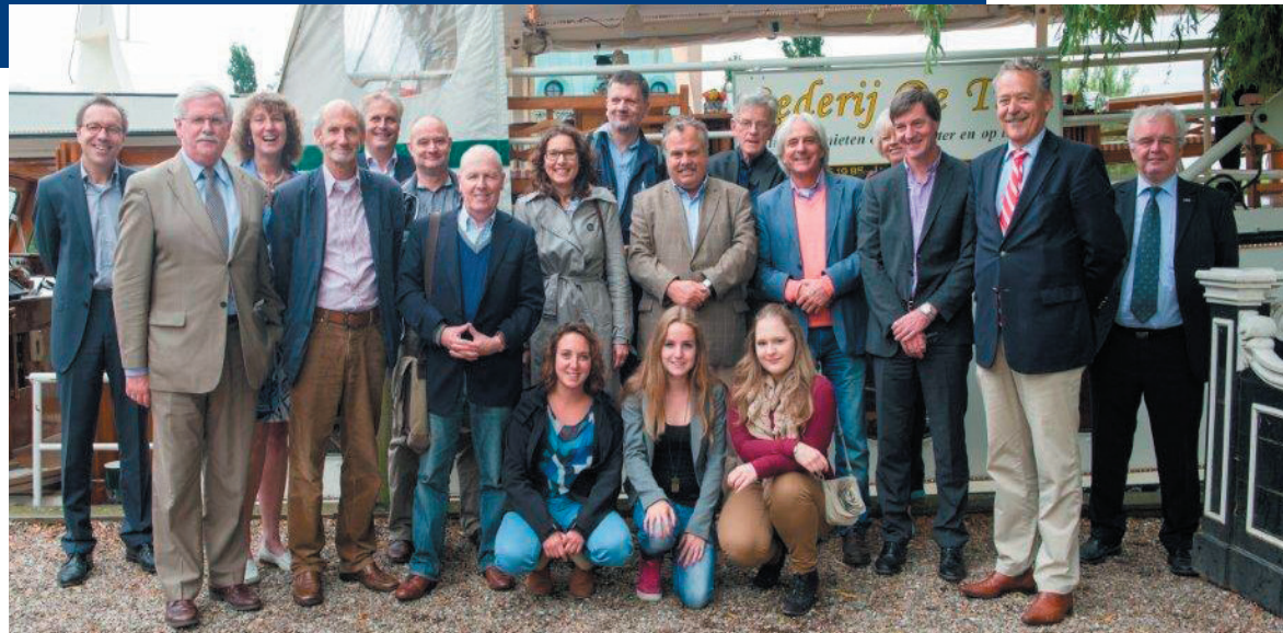
“Eerder dit jaar ging het college al in gesprek met diverse vrijwilligers uit onze gemeente”

Op 24 september 2013 heeft het college van B&W hun tour van 2013 afgerond met een bezoek aan Maarssenbroek. Ieder jaar bezoeken burgemeester en wethouders de kernen van de gemeente om uit eerste hand te horen wat er leeft in de gemeente. Tijdens deze dagen ging het college in gesprek met vrijwilligers van diverse organisaties, die allen op hun manier een bijdrage leveren aan de maatschappelijke binding in Stichtse Vecht. Eerder dit jaar ging het college al op bezoek bij verschillende partijen uit Maarssen, Breukelen, Loenen aan de Vecht, Nieuwersluis, Oud-Zuilen, Vreeland, Nigtevecht, Tienhoven, Kockengen, Nieuwer ter Aa en Loenersloot.